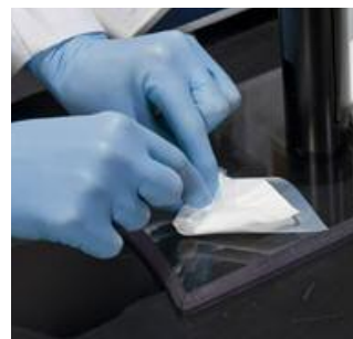
Schritt 1: Einwaage der Probe in den Trac Film